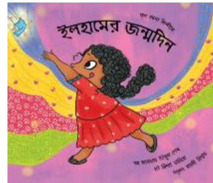
AftabYusuf Shaikh 「イルハームの誕生日」