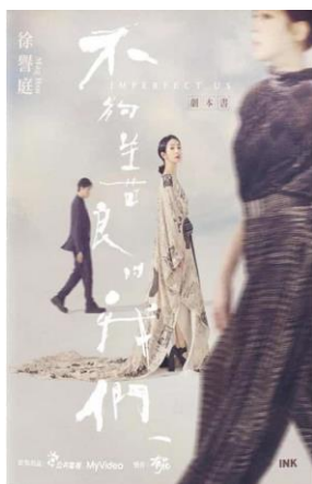
善良じゃない私たち